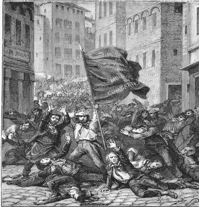
Insurrection de Lyon.